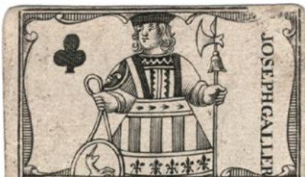
Klør Knægt med trykkerens navn på.

bevaret og helt identisk sæt musikalske kort, omhyggeligt kommenteret og gengivet blad for blad.